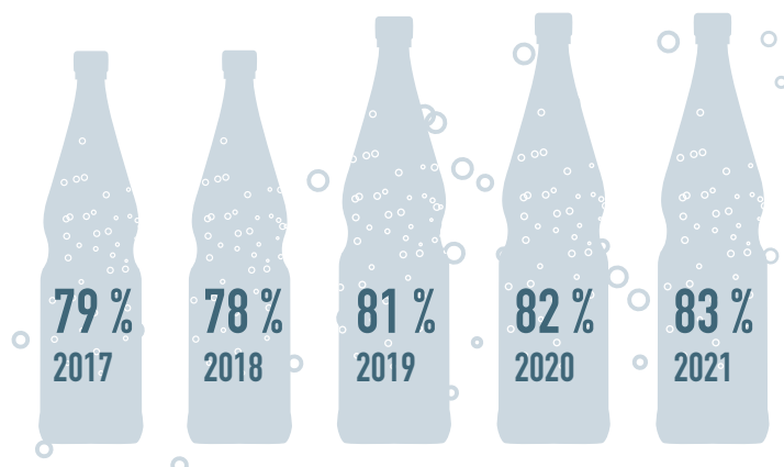
ANTEIL DER MEHRWEGVERPACKUNGEN*