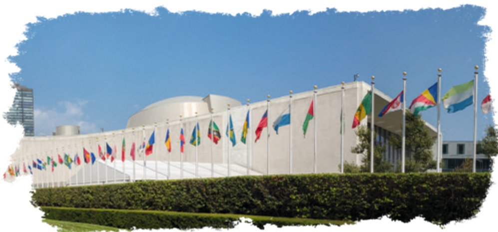
Gebäude der Generalversammlung der Vereinten Nationen (UN-Vollversammlung)

Wer sich mit nachhaltigem Handeln auseinandersetzt, wird immer wieder neue Ansätze finden, seine Aktivitäten zu optimieren. Auch wir arbeiten konsequent weiter an der Reduzierung unseres CO 2 -Fußabdruckes. Als regional verwurzelt Unternehmen übernehmen wir von Beginn an bis heute Verantwortung für unsere Umwelt, unsere Gesellschaft und unsere Beschäftigten. Dieser Nachhaltigkeitsbericht zeigt, welche Maßnahmen wir bereits erfolgreich umgesetzt haben und welche Ziele wir derzeit verfolgen.